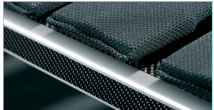
Flach und leicht: die neue Luxusliege Carbon-Flex von riposa im schicken Textil-Look.