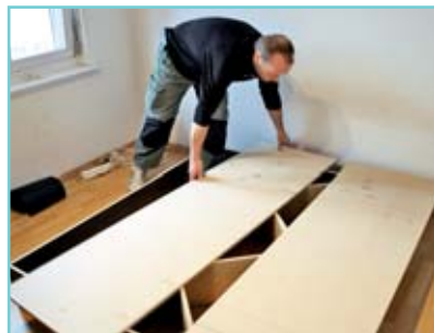
Der Unterbau wird demontiert