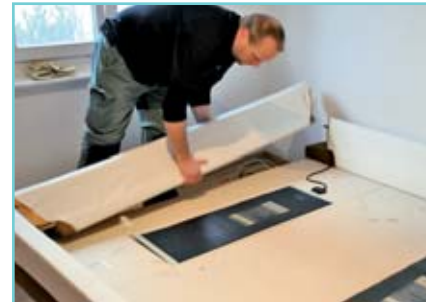
Die Seitenteile werden abmontiert