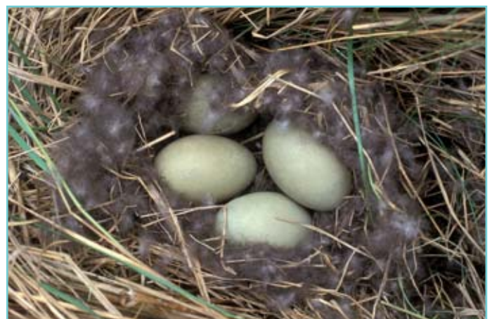
Die Eiderente kleidet ihr Nest mit ihren Brustdaunen aus