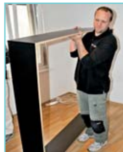
Der Rahmen ist transportfertig