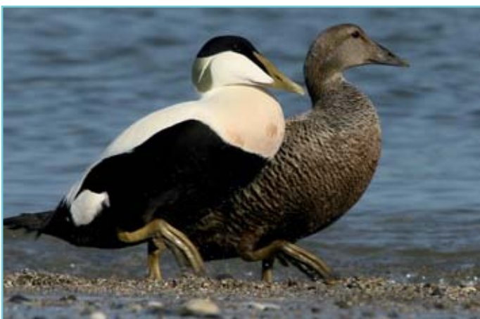
Eiderente (rechts) und Eidererpel

Die speziellen Eigenschaften der Eiderdaune, die aufwändige Gewinnung und die sorgfältige Verarbeitung und die exklusive Seidenfassung haben natürlich auch ihren Preis: 4'990 Franken kostet ein Duvet in der Standardgrösse 160 x 210 cm. Aber dafür werden Körper, Geist und Seele Nacht für Nacht beim Einkuscheln ins Eiderdaunenduvet mit einem unbeschreiblichen Wohlgefühl verwöhnt. ■