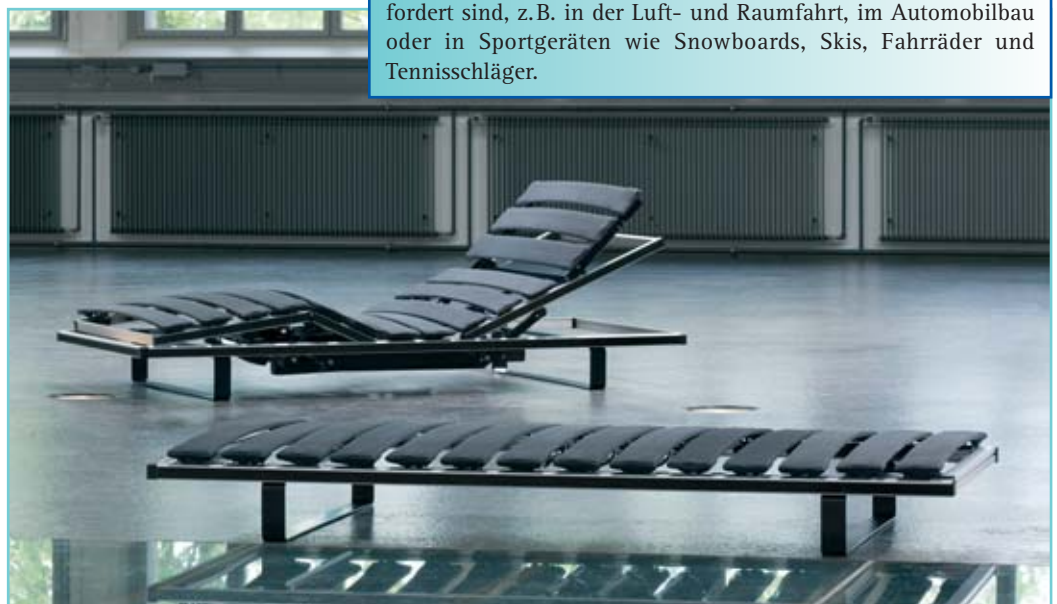
Ein Meisterwerk des Leichtbaus: Der riposa Carbon-Flex ist aus hochwertigen Qualitätswerkstoffen hergestellt.

Carbon bedeutet Kohlenstoff und ist ein chemisches Element. Carbon bezeichnet aber auch einen hochwertigen Werkstoff, der aus Kohlenstoff-Fasern besteht. Dieser Werkstoff wird eingesetzt, wenn hohe gewichtsspezifische Festigkeit und Steifigkeit gefordert sind, z.B. in der Luft- und Raumfahrt, im Automobilbau oder in Sportgeräten wie Snowboards, Skis, Fahrräder und Tennisschläger.