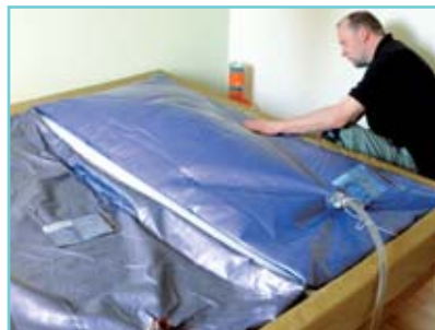
Die Matratzen werden wieder aufgefüllt