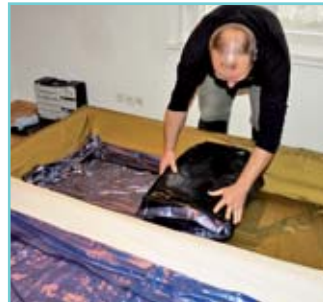
Die Matratzen werden zum Transport zusammengelegt