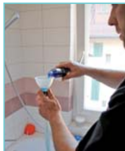
Dem Wasser wird ein Fungizid beigemischt