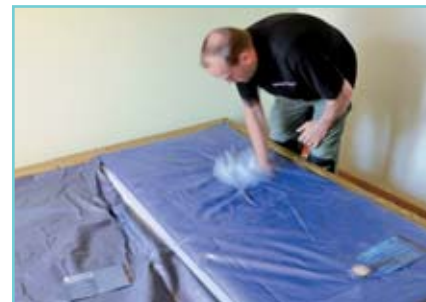
Die Hüllen werden mit einem Pflegemittel behandelt