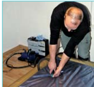
Mit einer Spezialpumpe wird das Wasser restlos abgesaugt

Auf diese Weise können die Besitzer die letzte Nacht in der alten und die erste Nacht in der neuen Wohnung auf ihrem Wasserbett geniessen und brauchen sich dazwischen keine Sorgen um das fachmännische Entleeren, den Transport und die perfekte Installation ihres Bettes zu machen. ■