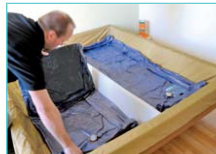
Am neuen Ort wird das Bett wieder aufgebaut