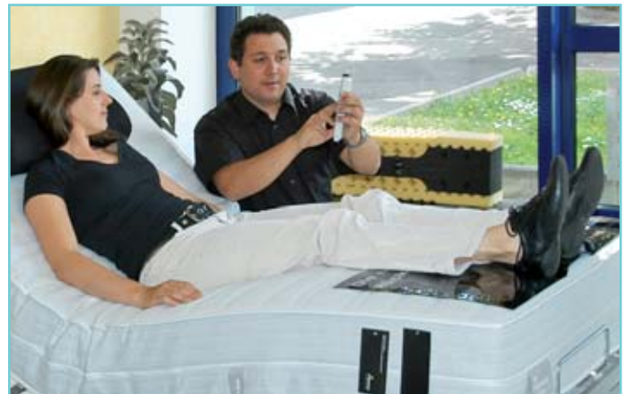
Individuelle Beratung und Demonstration des riposa-Bettensystems im Betten-Studio Kneubühler

Wer hohe Ansprüche an Komfort stellt und zugleich Wert legt auf ein ästhetisch überzeugendes Einrichtungsobjekt, der liegt mit dem eleganten Carbon Flat Automatic System (CFA) absolut richtig. ■