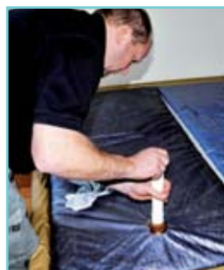
Die Luft wird vollständig abgesaugt