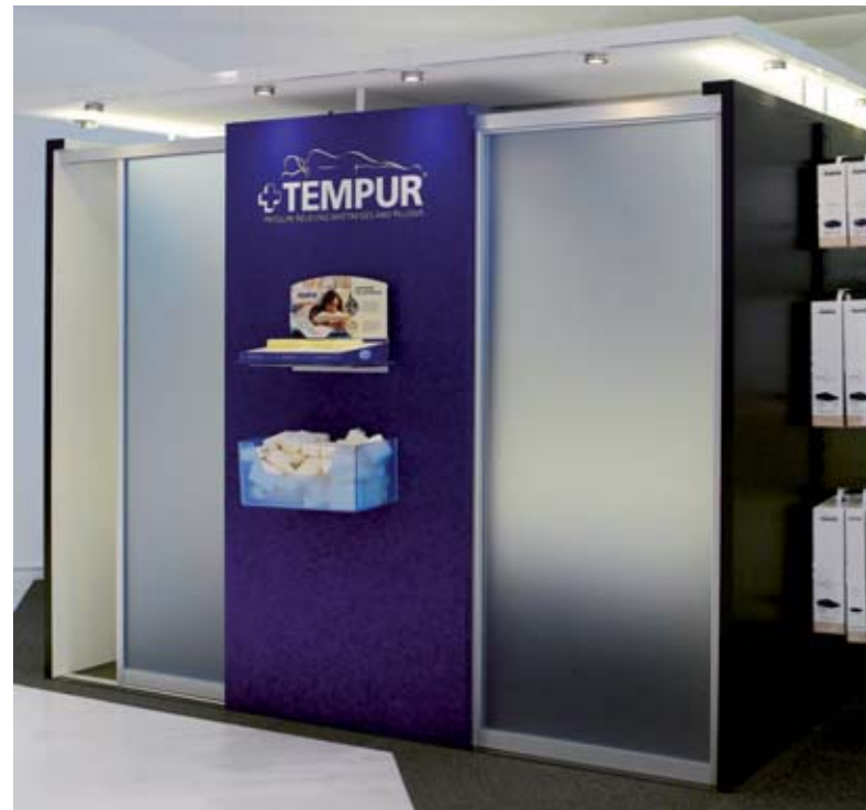
Lädt zum Ausprobieren ein: Das «TEMPUR®-Experience Center» im Betten-Studio Kneubühler.

Aber überzeugen Sie sich doch selbst. Kommen Sie einfach in unser Geschäft und probieren Sie aus, was am besten für Sie passt. Und lernen Sie das entspannende TEMPUR®-Gefühl beim Probeliegen in unserem TEMPUR®-Experience Center kennen.