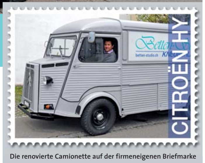
Die renovierte Camionette auf der firmeneigenen Briefmarke

Während vier Wochen wurden das Chassis, die Aufhängung und der Aufbau gründlich überholt, die Auspuffanlage sowie korrodierte Blech- und Aluminiumteile ersetzt und die Sitze neu gepolstert. Den Abschluss der Renovierung bildete eine komplette Neulackierung.