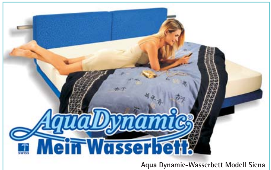
Aqua Dynamic-Wasserbett Modell Siena