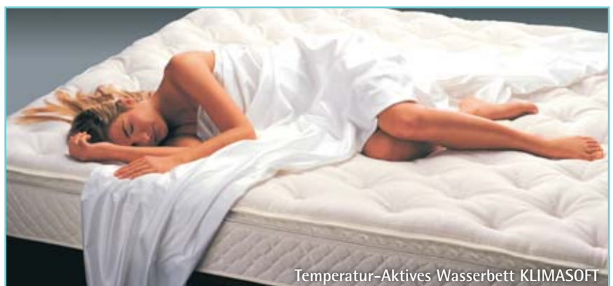
Temperatur-Aktives Wasserbett KLIMASOFT