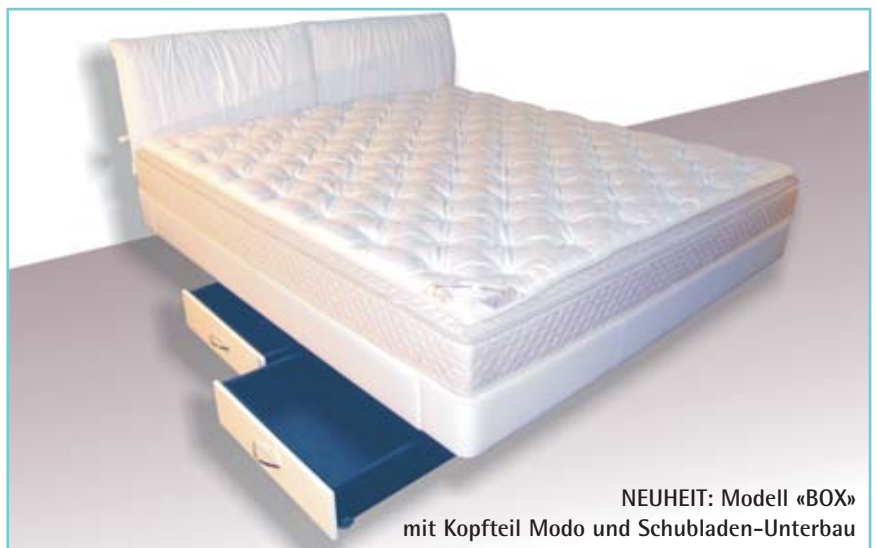
NEUHEIT: Modell «BOX» mit Kopfteil Modio und Schubladen-Unterbau